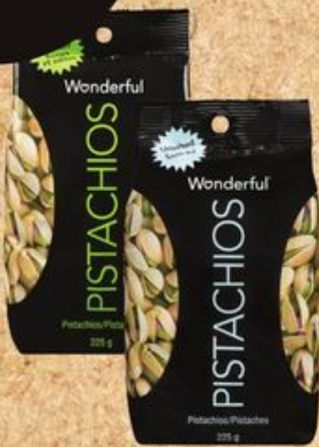
Pistaches Wonderful, salées et sans sel, 225 g Limite de 6, ou 5$ ch. après limite Wonderful salted or unsalted pistachios, 225 g 2108543001_CA, 21018479_CA